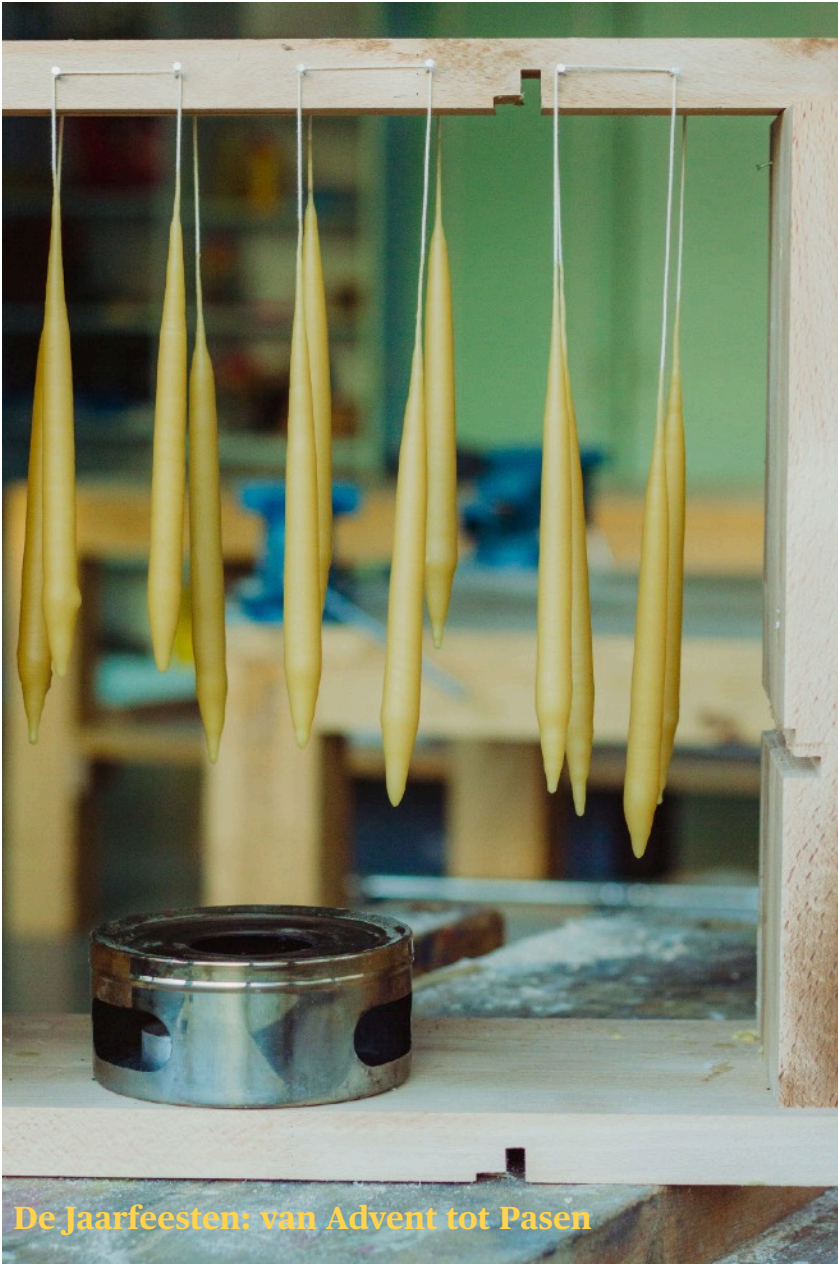
De Jaarfeesten: van Advent tot Pasen