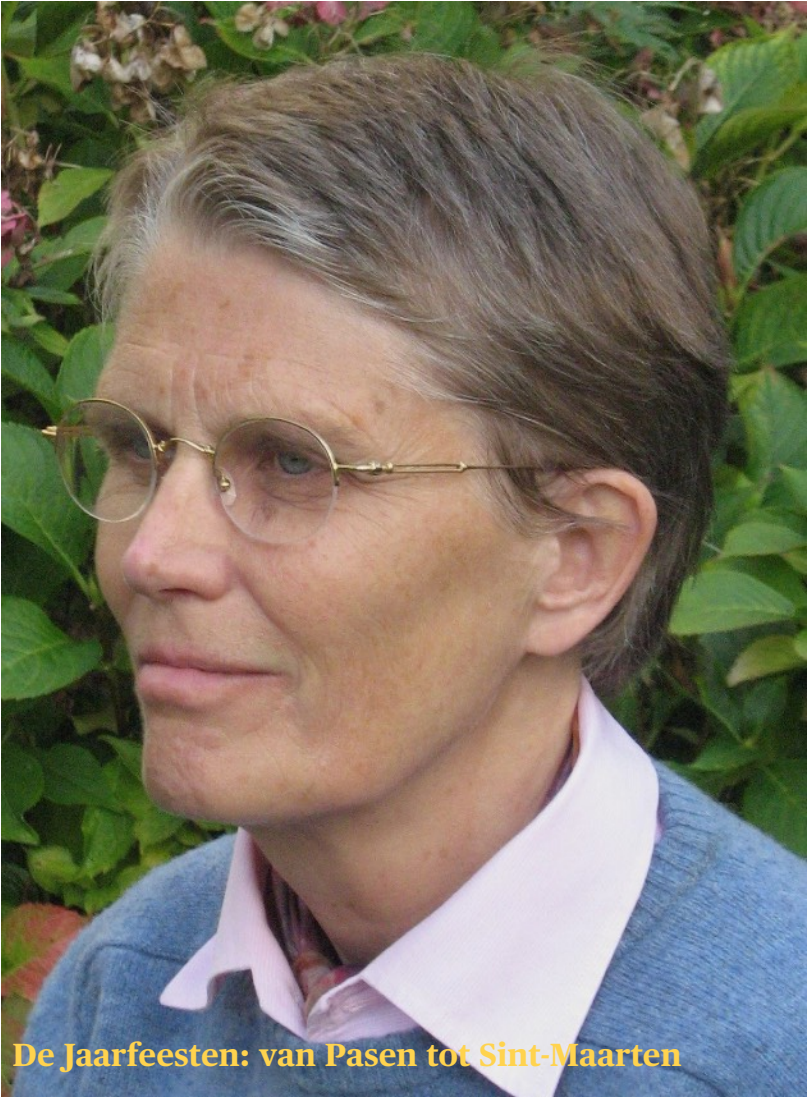
De Jaarfeesten: van Pasen tot Sint-Maarten