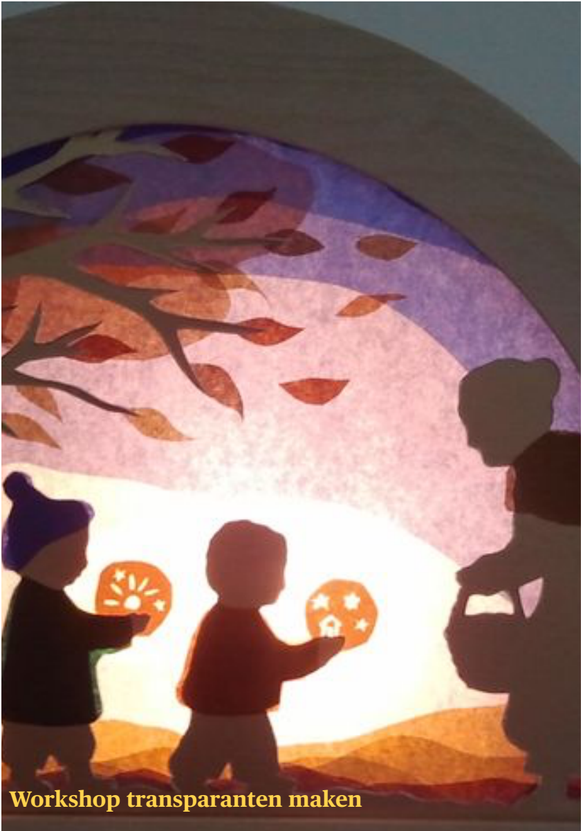
Workshop transparanten maken